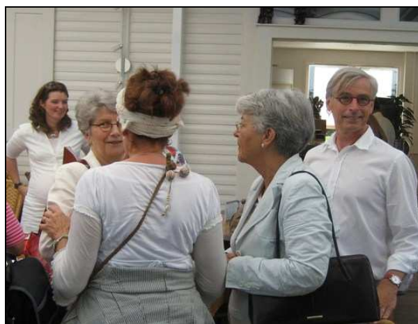
Een gezellige borrel!